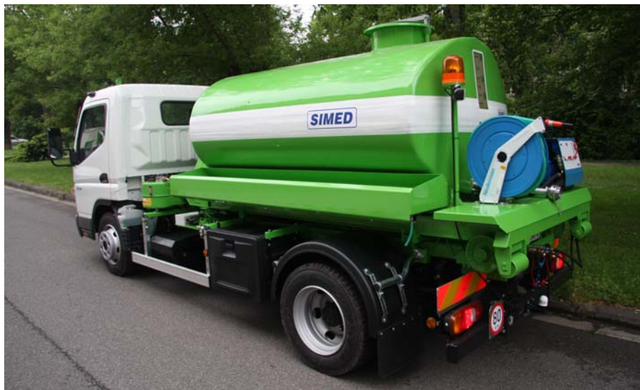
Vozidlo s cisternovou nadstavbou

MITSUBISHI FUSO 3S15 s motorom Euro 5b+, s celkovou hmotnosťou 6.000 kg, nosnosť podvozku 3.850 kg. Maximálna dĺžka vozidla s nadstavbou 4 635 mm.